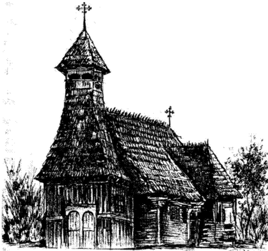
a magyarrégeni görög katolikus templom, 1744 (Ősz. P. Zoltán rajza)

Régiség tekintetében az evangélikus templom után a magyarrégeni ortodox (egykor görög katolikus) templom következik. 1744-ben épült; 85 kereszt alakú, hossza 15 méter, belső szélessége 6 méter, magassága 13-14 méter. Falait vakolatlan fenyőgerendák képezik, fedele zsindele borítású. A hatszög alakú oltár szárnyai, a templom beltere és előcsarnoka gazdagon díszített. A szentélyt és a templombelsőket Toader festőművész értékes freskói borítják. Megjegyzendő, hogy a román művelődéstörténetben oly nevezetes Erdélyi Iskola egyik kiváló képviselője, Petru Maior, lelkészként itt kezdte tevékenységét. Az ő gondoskodásából építették a harangtornyot, és a déli ajtót újjal helyettesítették.