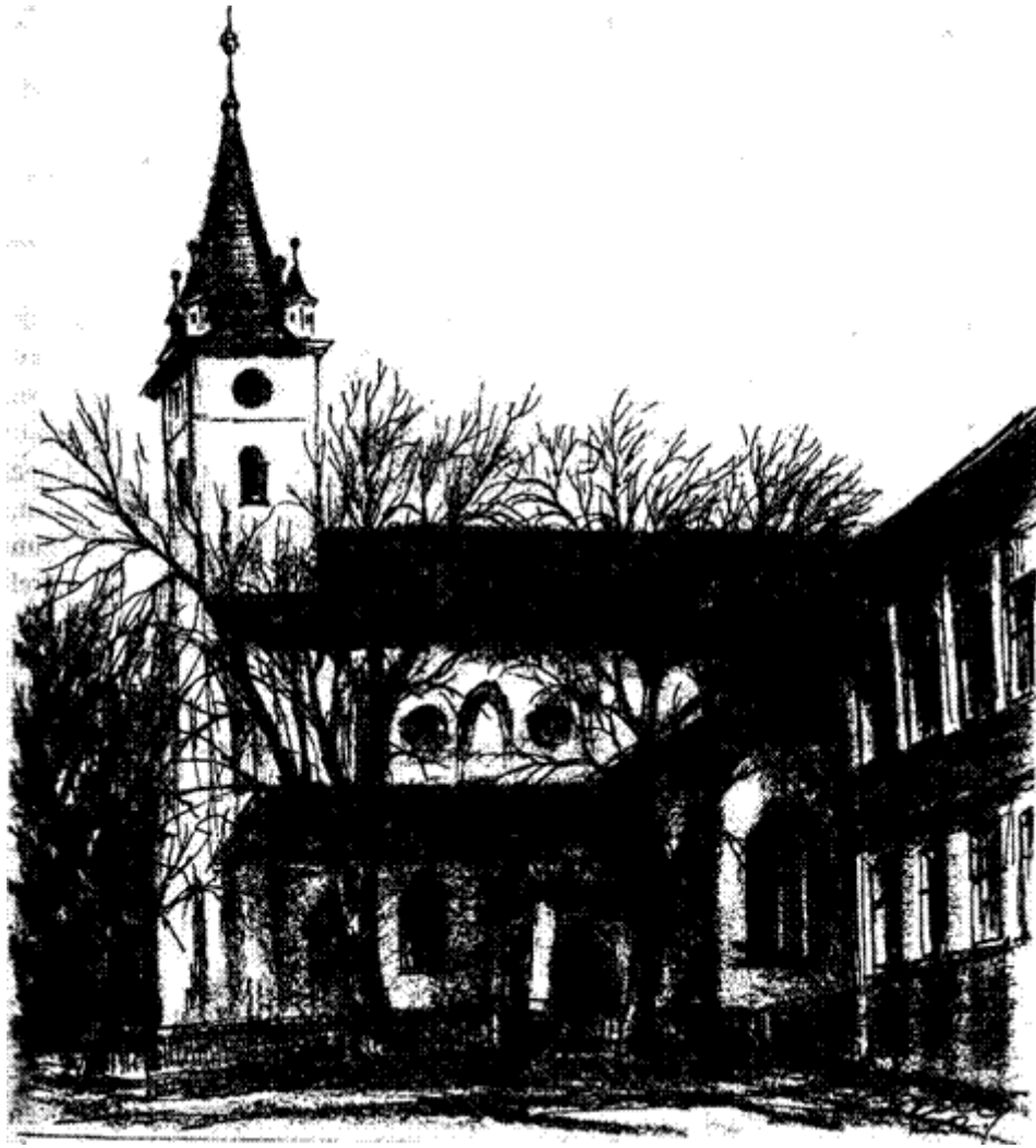
A szászrégen evangélikus templom déli oldala, 1330 (Ősz. P. Zoltán rajza)

A Mária tiszteletére épült korai gótikus templom szerkezetét tekintve háromhajós bazilika felépítést mutat, sokszögzáródású főszentéllyel és a főhajóba beugró nyugati toronnyal. A bazilikális elrendezésű templom ilyen stílusban állott fenn 1708-ig, amikor is egy nagy tűzvész elpusztította fő- és mellékhajóit, tornyát. A torony, a főhajó és az északi mellékhajó fedetlen maradt, csak 1778-ban fedik újra, és kap a hajó csehboltozatot. Újjáépítése során olyan módosításokat alkalmaztak, amelyekkel megváltoztatták az épület egy részének eredeti stílusát. Mai formáját az 1927-1930-as és az 1959-1961-es restaurálásakor kapta. Művészettörténetileg értékes épületrészei, Müller Gusztáv műépítész szerint 81 a következők: