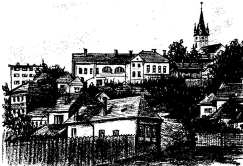
A szászrégen evangélikus templom és az egykori evangélikus leányiskola (Ősz P. Zoltán rajza)

A helységet nyugaton a Bodogáj-, a Kosár-, a Kerek-, a Fritsch- és a Hédelerdő övezi. A várostól délre a termékeny Marostere tárul fel, melyet keletről a Görgényi-havasok nyúlványai határolnak; előterükben a Mocsárdó és a cukorsüveg alakú görgényszentimrei Rákóczi-hegy található, mögöttük a Kereszt-hegy (1515 m) és a Mezőhavas (1777 m) sötétlik. E pompás tájképet a Rákóczi-hegytől északra lévő Nyerges-hegy és a Kelemen-havasok zárják be. Ezen gyönyörű keret közepén fekszik az egymással összeépült Régen: Szászrégen, a városi déli. Magyarrégen pedig az északi részén.