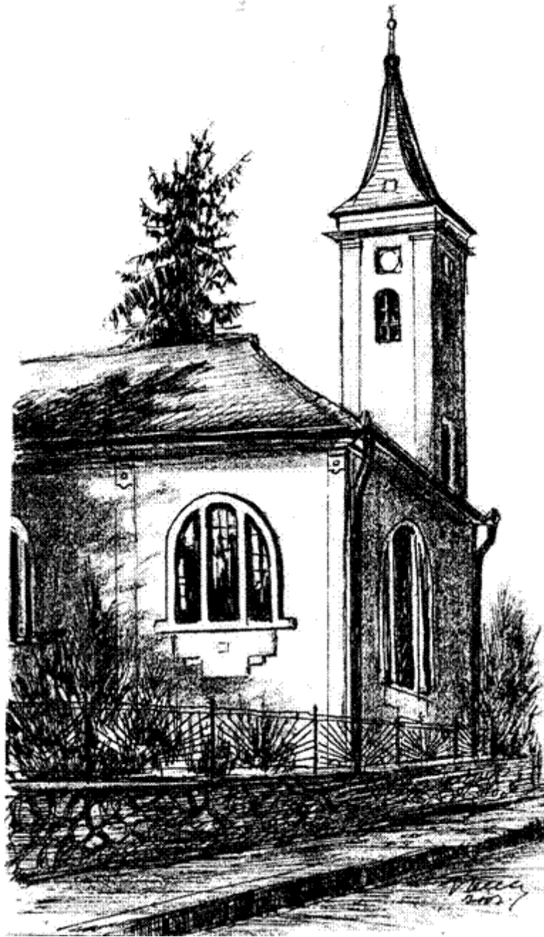
A magyarrégeni református templom (Ősz. P. Zoltán rajza)

A Szénapiac közelében levő görögkeleti templom (egykor görög katolikus) 1811-ben készült el, addig a közeli házban tartottak istentiszteleteket. 89