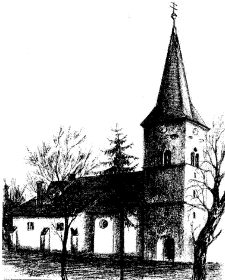
Az abafáji római katolikus templom (Ósz. P. Zoltán rajza)

Abafája, Régen tószomszédja, 1876-ig Torda, majd Maros-Torda vármegye, Régen alsó járásához tartozott. Évszázadokon át önálló település volt, közigazgatásilag csak a XX. század közepe táján, 1956-ban vált Régen részévé. Régentői délre fekszik. Nevének előtagja a magyar Aba személynév, utótagja pedig a birtokos személyraggal ellátott fa, erdő. Román neve Apaiina (apa liná = csendes víz, lassú víz). 100 Nevének előfordulása a dokumentumokban: Abafa, Abafalva, Abafaya, Abbafaya, Abafaia, Abafalua, Abafája.