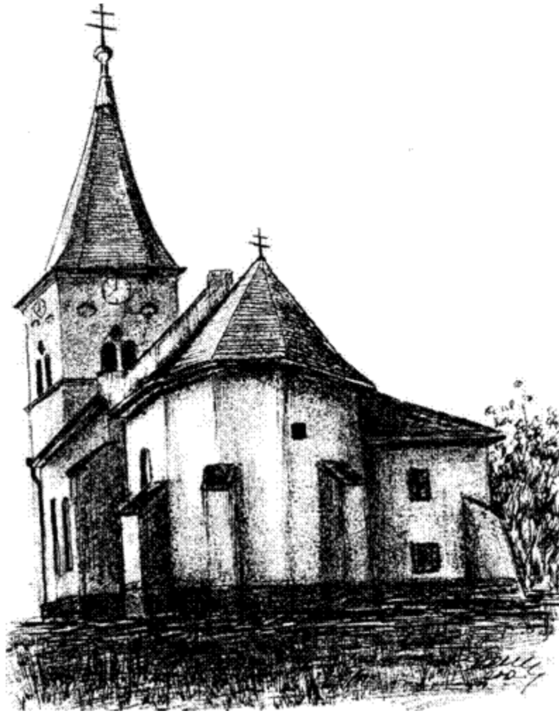
Az abafáji római katolikus templom keleti oldala, XIII.sz.

Beházasodás folytán Abafáján birtokos volt a báró Bornemisza család is. Ez az ág a kászoni nemesekből emelkedett főúri rangba. A XVII. század végétől kezd jelentősebb szerephez jutni. Kászoni báró Bornemisza János 1708-ban csíki főkirálybíró, később udvari kancellár, majd főkormányiszéki tanácsos. Felesége Haller István (Torda vármegye főispánja, majd a főkormányiszék elnöke) Jeánya: Borbála. Haller István második felesége Torma Borbála, Torma Éva testvére. Ezen a jogon Abafáján is birtoka volt. Bornemisza János fia, Pál már mint abafáji birtokos Mikes István leányát, Annát (Mikes Kelemen unokatestvérét) vette feleségül.