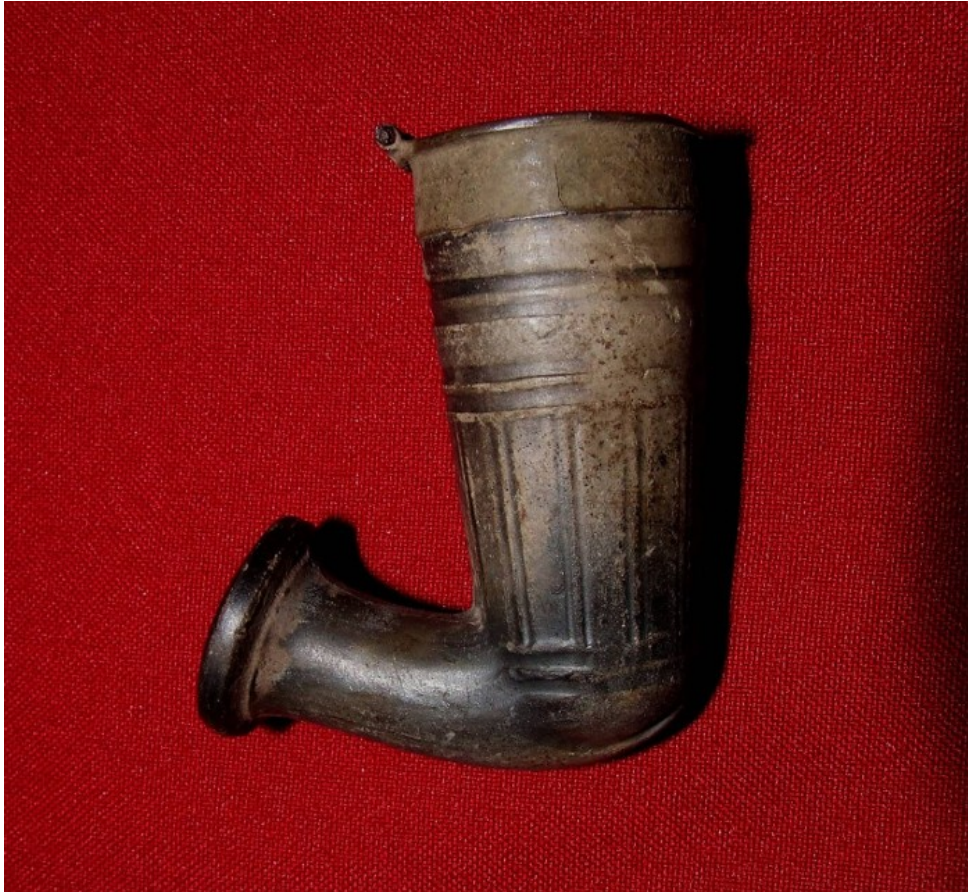
6. ábra: Húzogatott pipa (A szerző képe saját pipájáról)

Ennek a mára teljesen eltűnt tárgytypusnak a jelentőségét több minden mutatja. A pipa szó a mai köztudatban több jelentéssel is bír, hisz mindenféle pipa formájú tárgyat szintén pipának nevezünk, pl. bűvárpipa. A pipa a férfiasság szimbóluma volt, és a személy vagyoni helyzetét is mutatta. Kiegészítőként hozzátartozott a férfiak viseletéhez, és a férfi halálakor kedvenc pipáját is vele temették. A cseréppipa gyári termelése ellehetetlenítette a mesterembereket, így a mesterség mára mondhatni teljesen kihalt. A pipázás szokása is háttérbe szorult a múlt század elején. A cigaretta és a szivar elérhetőbbé vált és praktikusabb volt, mint a lassú és nyugodt körülményeket igénylő pipázás.