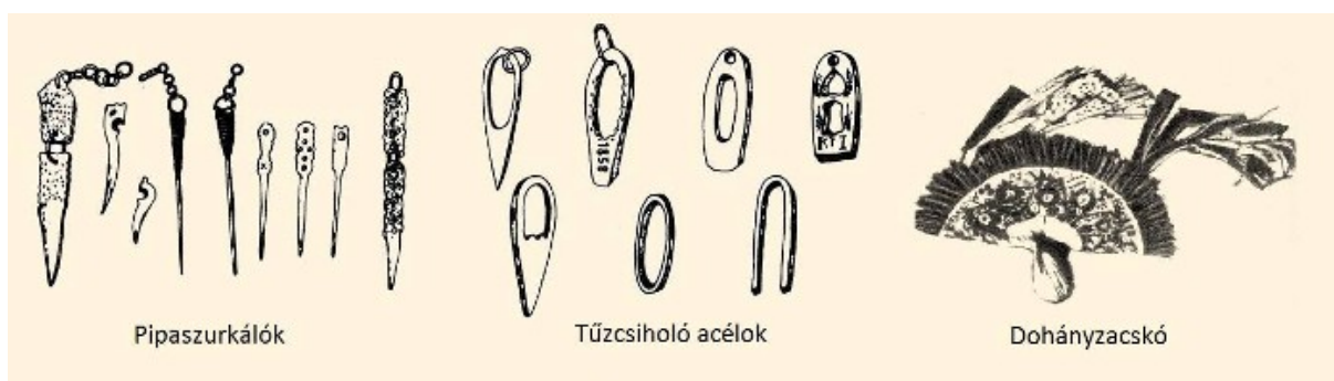
1. ábra: A pipázás kellékei a XIX. század második feléből (képösszeállítás a Magyar Néprajzi Lexikon képeiből, Magyar Néprajzi Lexikon, szerk.: Ortutay Gyula, 1982)

A pipázást se az egyház, se pedig a nemesek nem nézték jó szemmel, sőt, tiltották. A rendeletek azért nem engedélyezték a pipázást és szivarozást, mivel ez tűzveszélyes szokás volt, hisz a gyufa feltalálása előtt „acél-kova-taplóval” gyújtottak rá. Ebből sok esetben tűz keletkezett. 1633-ban Konstantinápolyban ütött ki nagy tűzvész, ami miatt Ibrahim és IV. Murat szultán halálbüntetéssel sújtotta a dohányzókat. A szokás ennek ellenére gyorsan terjedt.