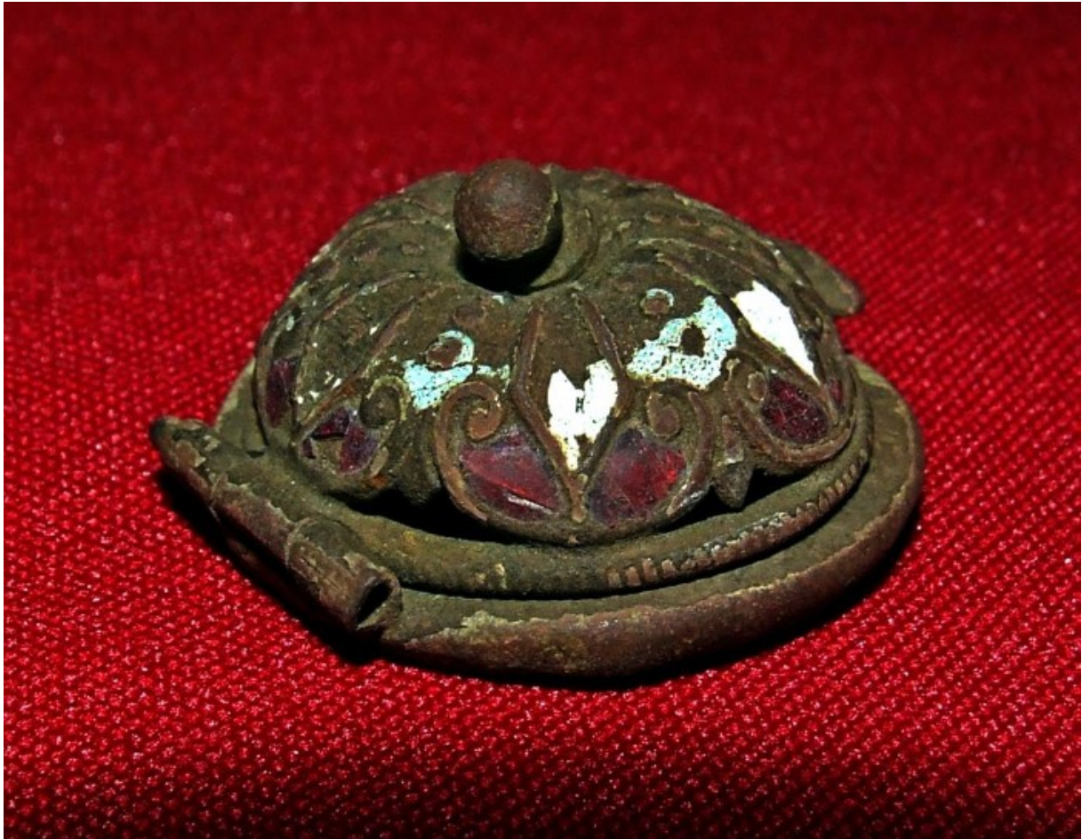
3. ábra: Szébb napokat megélt, eredetileg zománcozott és aranyozott pipakupak

Több tájfajta pipadohányt termesztettek hazánkban, melyek közül híresebb volt a debrői, kóspallagi vagy a verpeléti. A férfiak hobbija és szenvedélye volt a különböző dohánykeverékek készítése. A dohányleveleket házi fermentáló és pácoló eljárásokkal javították. Amikor elfogyott a dohány, a parasztemberek meggyfalevéllal pótolták.