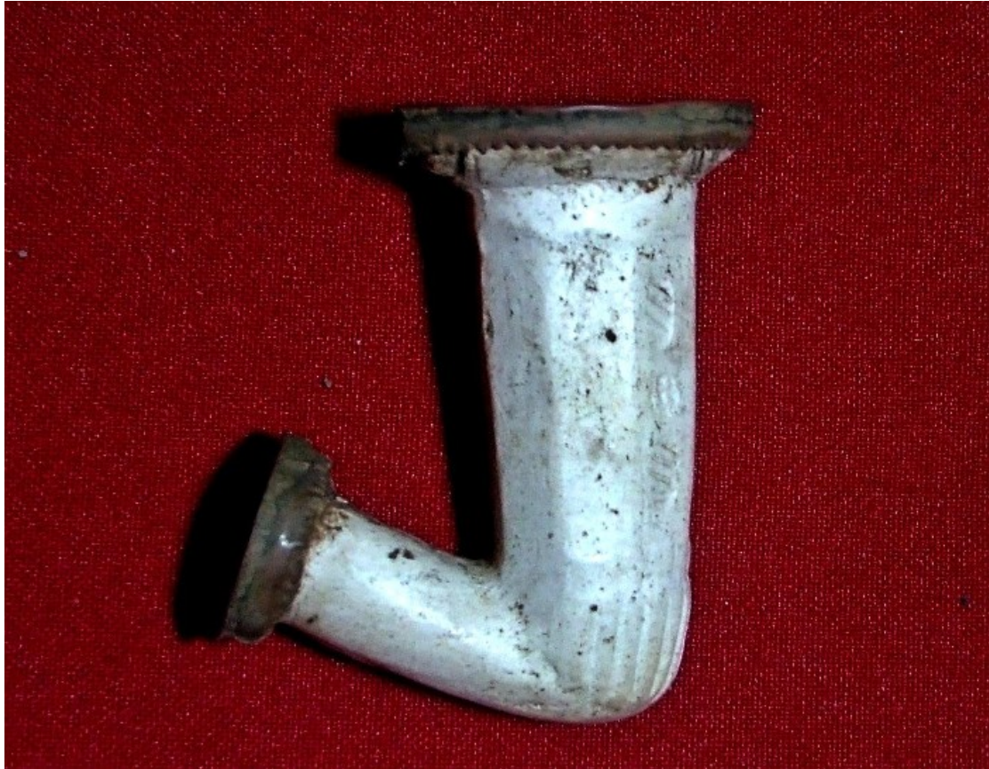
5. ábra: Debreceni karimás pipa

A cseréppipáknak több formája is kialakult. A híresebbek közül való a makrapipa (4. ábra, 7. kép) vagy csalópipa, mely egy Makra nevű alföldi betyárról kaphatta a nevét. Ezek a pipák inkább díszként szolgáltak nagy méretük miatt. A palatinszki pipa egy alföldi szegénylegényről kapta a nevét, jellegét a pipa derekának alján körkörös behúzgált díszítés adta (4. ábra, 1. kép). Egy betyárról kapta a nevét a zsubrik pipa is, minek névadója a híres Sobri Jóska volt (4. ábra, 6. kép). A debreceni karimás pipa volt talán a legkedveltebb pipa. Kisebb és nagyobb méretben készült, nevét a szája körül futó karimáról kapta (5. ábra). A pendelykorcú pipa vagy más nevén húzogatót, ritkábban macskakarmolta pipa nevét rovátkolt díszéről kapta (6. ábra). A tányéros pipa az alján elhelyezkedő tányér miatt kapta nevét. Ezek a pipák gazdagon díszítettek voltak. A társas pipa tekinthető a legkülönlegesebbnek, hiszen ezt egyszerre több ember is szívhatta volna, mivel az alján több lyukat helyeztek el, de ezeket sohasé használták.