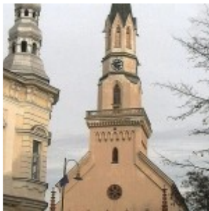
a fő homlokzat