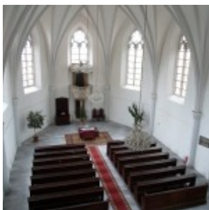
a templom beltere