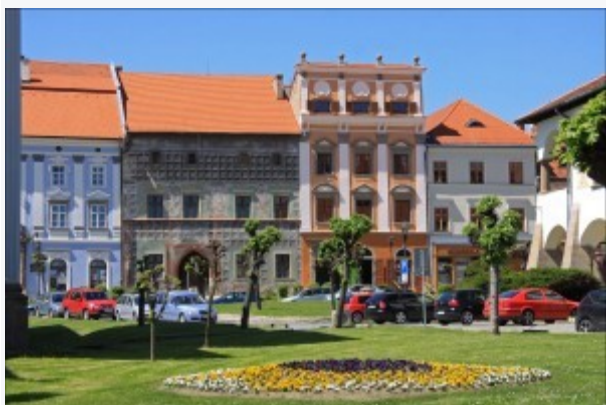
Pál mester háza

Lőcse központi tere a város legjelentősebb személyiségnek, Pál mesternek nevét viseli. A késő gótika kiváló szobrásza és falfaragója Szlovákia legnagyobb középkori művésze volt, legfőbb alkotása a Szent Jakab templom világhírű oltára, melyet 10 éven át készített és a legenda szerint magát is ábrázolta rajta a 12 apostol egyikeként. A Pál mester tér körül sorakoznak Lőcse legszebb épületei, gyönyörű állapotban fennmaradt reneszánsz és barokk műemlékek, melyek a 14-15. században a város legtehetősebb kereskedőinek birtokában voltak. A több mint 50 ház ma is egykori tulajdonosainak nevét viseli, köztük van Pál mester háza is.