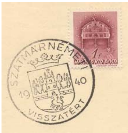
"SZATMÁRNÉMETI VISSZATÉRT 1940." bélyegzővel ellátott boríték.