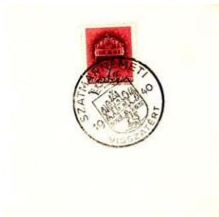
"SZATMÁRNÉMETI VISSZATÉRT 1940." bélyegzővel ellátott boríték.