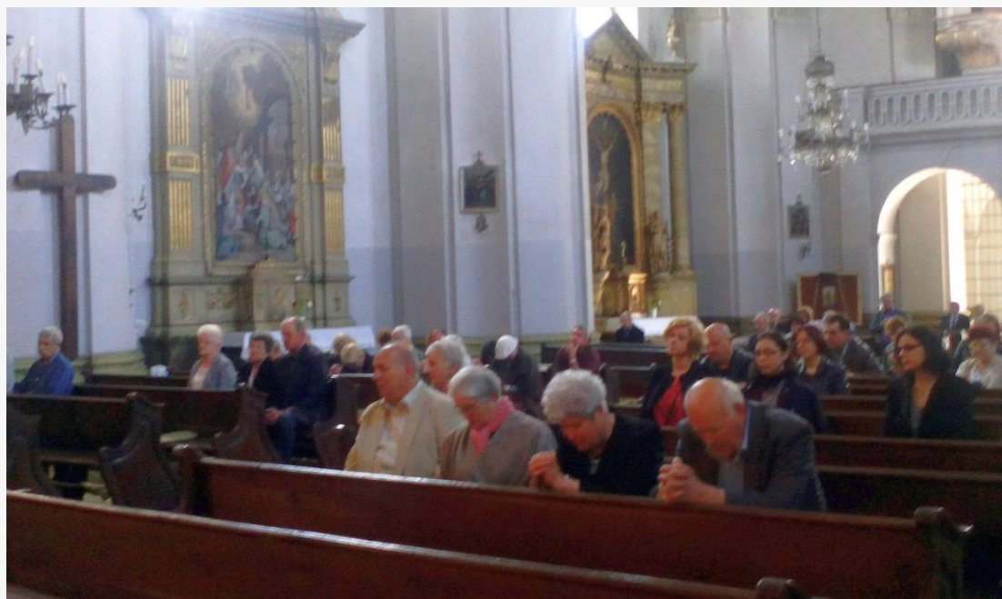
A 250 éves évfordulón tartott szentmise és emlékülés résztvevői

Egész napos programmal emlékeztek Erzsébetvárosban az örmény főtemplom alapkövetételének 250. évfordulójára. A templom múltja, története gazdag, akárcsak az építő örmény közösségé, jövőjét azonban intő jelként összegzi mai, aszimmetrikus arculata, ami egy 1927-es vihar következménye. Akkor egy szélvihar lesodorta az északnyugati torony sisakját, amit azóta sem sikerült visszaállítani. Bögözi Attila írása.