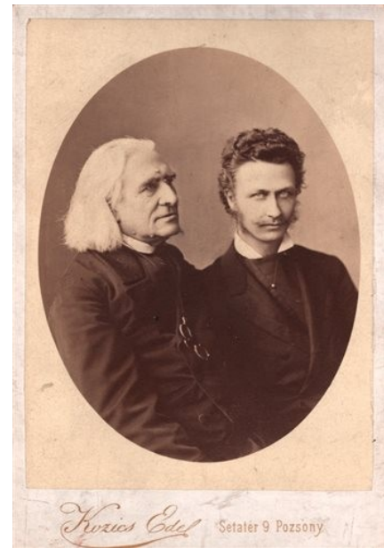
Mosonyi és Liszt

Mosonyi Mihály zeneszerző, Erkel fiainak későbbi tanítója azok közé tartozott, akik megpróbálták nemzetközi szintre emelni a leáldozóban lévő verbunkost. 1832 és 1835 között Pozsonyban tanult, miközben újságkihordásból és betűszedésből tartotta fenn magát. Zenei fejlődése szempontjából azonban lényegesebb, hogy a városban leckéket vett Turányi Károlytól. Hálás tanítványként később neki ajánlotta Grand duo zongorára négykezesét és IV. vonósnégyesét. Mosonyi jó barátságban volt minden idők egyik legnagyobb zongoraművészeivel, Liszt Ferencel (aki a Mosonyi gyászmenete című művével fejezte ki a halála miatti szomorúságát). Lisztet jóval bensőségesebb szálak fűzték Pozsonyhoz, mint az eddig említett művészeket. Amikor kilencévesen, 1820. november 26-án hangversenyt adott Esterházy Mihály grófnál, a ma is álló Ventúr utcai De Pauli-palotában, tökéletes játéka annyira elbűvölte a közönséget, hogy öt jelen lévő főúr (Amadé, Apponyi, Esterházy, Szapáry, Viczay) bécsi tanulmányi ösztöndíjat ajánlott fel számára. Ezzel nyílt meg előtte az út a zene nagyvilágába és a világhír felé, amit Liszt sohasem feledett el. Közvetlenül halála előtt barátja, Batka János pozsonyi levéltáros előtt kijelentette, hogy ebben a városban dőlt el zenei karrierje.