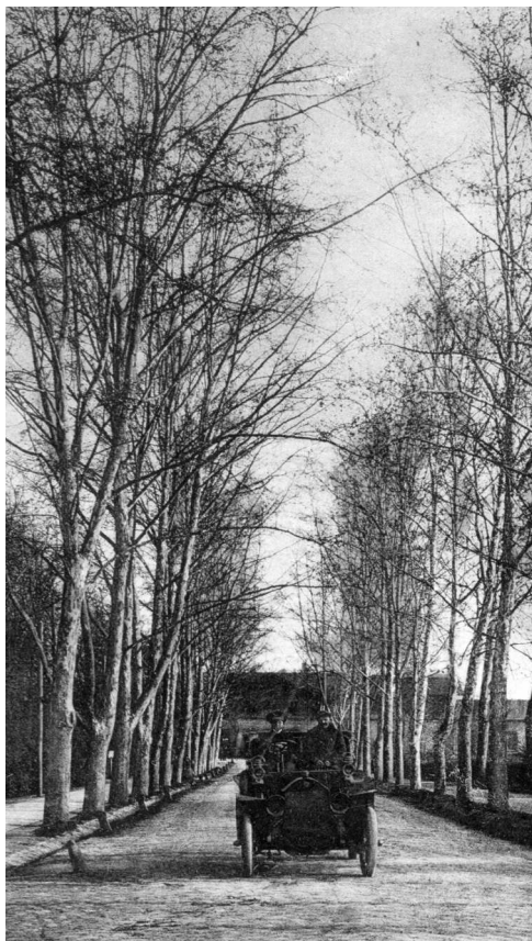
Zombor – vasúthoz vezető út

S végezetül, de nem utolsósorban, mind-egyikünkben felmerül a kérdés: Tényleg el