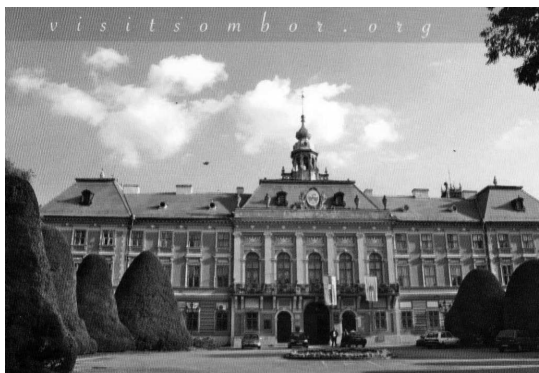
A zombori megyeháza napjainkban